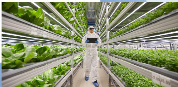
iFarm. Вертикальные фермы