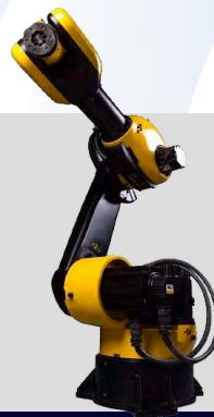
Эйдос Роботехника. Роботы манипуляторы для промышленных нужд.