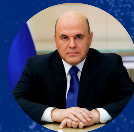
Председатель Правительства Российской Федерации М.В. Мишустин

Форум — главная площадка для обсуждения вопросов, связанных с реализацией Национального проекта «Международная кооперация и экспорт» и место встречи экспортеров, производителей, экспертов, регуляторов и институтов развития.