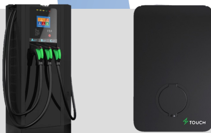
Touch. Зарядные станции для электромобилей