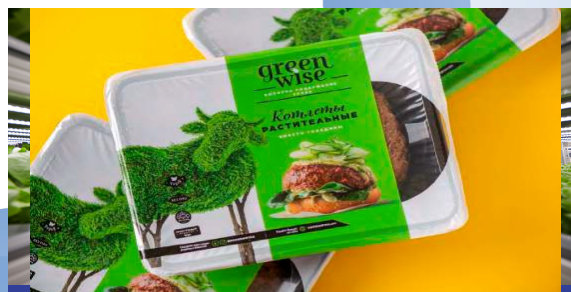
Greenwise. Альтернативное мясо.