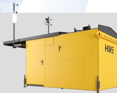
Hive. Производство первых в России дронопортов