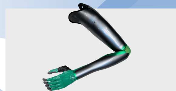
Моторика. Современные протезы рук