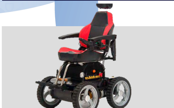
Обсервер. Кресло-коляска с электроприводом.