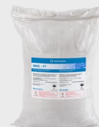
Биомикрогели. Очистка воды и твердых поверхностей