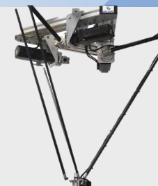
Nevlabs. Дельта-робот сортировщик мусора.