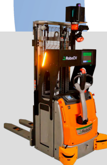
Robosv. Интеллектуальный роботизированный штабелёр для складского пользования.