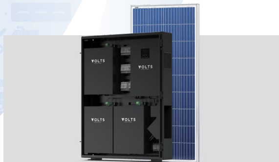
Volts Battery. Солнечная станция для дома