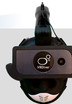
VRdiver. Подводная система виртуальной реальности