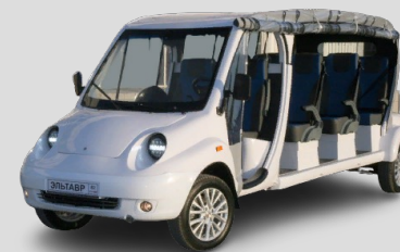
Эльтавр. Малый коммерческий электротранспорт