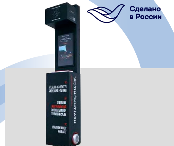
Сайнтификоин. Высокотехнологичный газоанализатор.