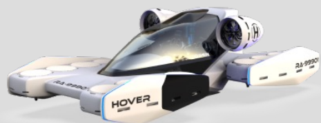
Hover surf. Летящие такси и кареты скорой помощи