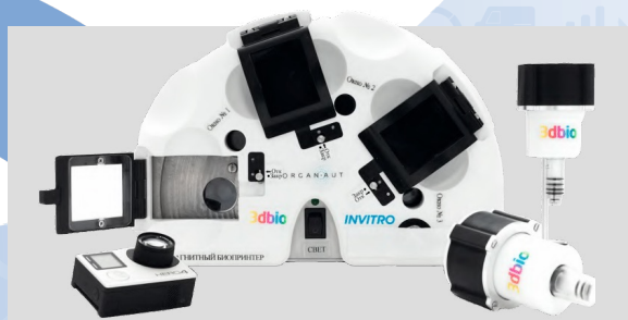
3D Bioprinting Solutions. 3D-принтер для печати тканевых и органных конструкций.